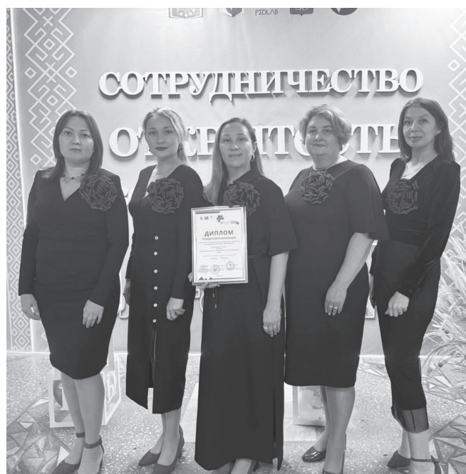
Команда «Само собой» города Агидель.

Конкурсное испытание состояло из двух частей: презентации команды под