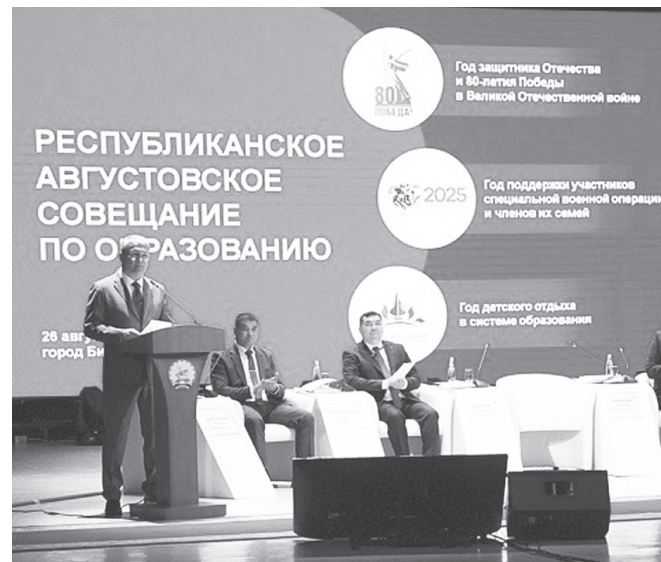
Выступление Главы Башкортостана Радия Хабирова на республиканском совещании по образованию.

Радий Хабиров, Глава Республики Башкортостан.