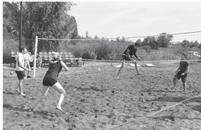
На пляжный волейбольный турнир съехались спортсмены из соседних городов и районов.