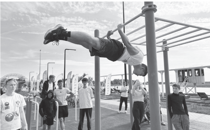
Стрит-воркаут — это одно из популярных течений в уличной молодежной культуре.