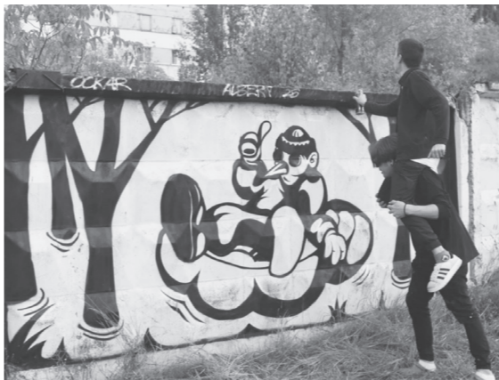
Для создания граффити можно использовать самые разные инструменты и возможности.

Ключевым для конкурсных работ была тема «На волне Агидели», а обязательным условием — готовность и наличие навыков для воспроизведения художественного изображения на крупных объектах городской среды. Художники, получив возможность самовыражения, превратили серый бетонный забор за автостоянкой возле торгового центра «Монетка» в яркое полотно современного искусства.