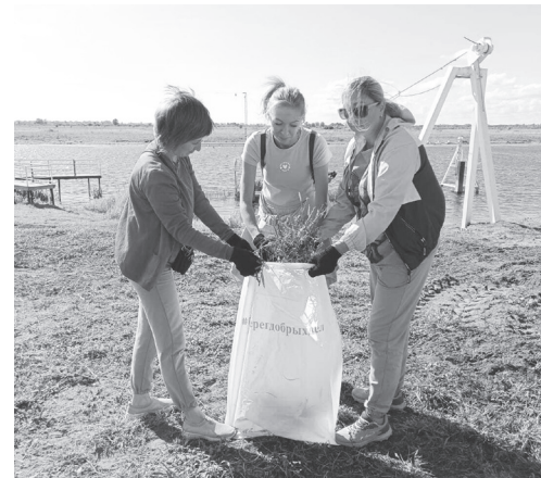
Волонтеры привели в порядок берег Апаиша.

В течение нескольких часов участники акции очистили берег от мусора, среди которого преобладали пластиковые бутылки, упаковки от еды и одноразовая посуда.