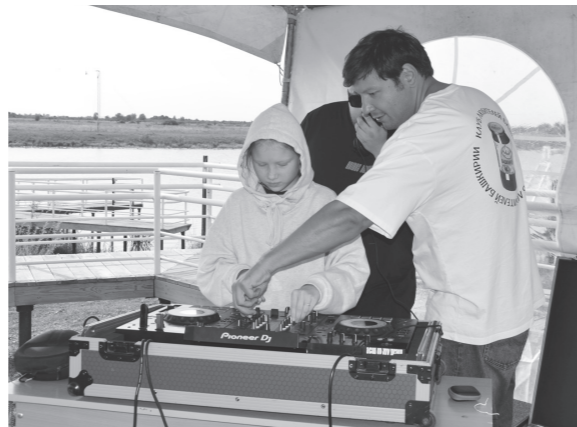
Мастер-класс по диджеингу привлек юных меломанов.