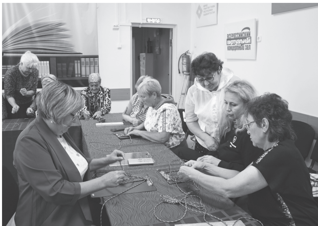
Плетение браслета из паракорда не требует особых навыков, главное - запомнить последовательность шагов.

В Агидели торжественное открытие «Дней армейской культуры» состоялось в Централь-