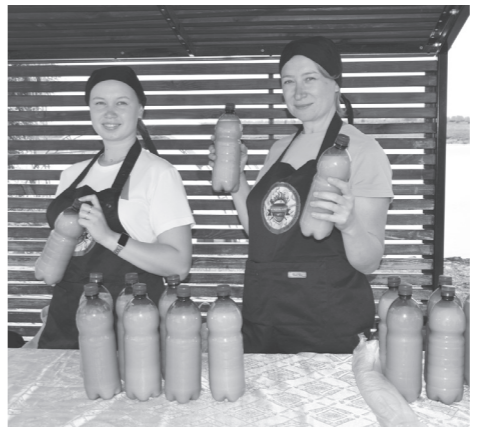
Для гостей фестиваля организовали дегустацию целебного кумыса.