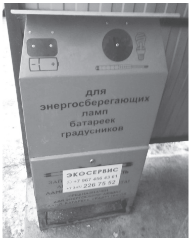
В городе стоят шесть таких контейнеров.

Мужчина сообщил, что во вторник в магазине будет проверка Роспотребнадзора. Он поинтересовался, будет ли она работать в этот день, на что по-