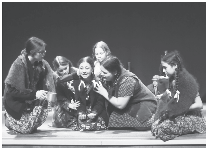
Игра детей просто завораживала зрителей.

Он также отметил, что больше всего олимпиадни-