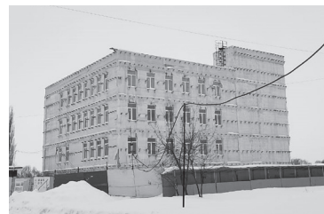
Агидельцы с нетерпением ждут открытия Дома культуры «Идель».

В газете «Огни Агидели» от 25 октября 2024 года, отвечая на вопрос местного жителя Венера Шафикова о сроках завершения строительства Дома культуры, мы рассказали о том, что реконструкция объекта ведётся с 2021 года. Государственный заказчик — Управление капитального строительства РБ.