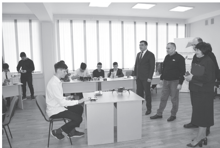
В «Точке роста» учащиеся продемонстрировали гостям свои умения и навыки.

ков поступает именно в нефтяной университет, что превышает показатели других вузов в целом.