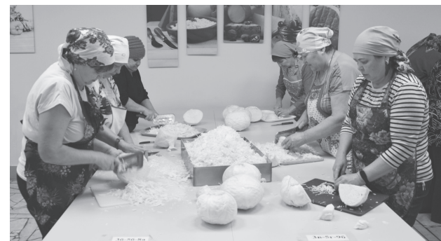
Женщины ловко рубили капусту, исполняя любимые песни.

200 килограмм капусты заквасили волонтеры для отправки бойцам СВО с ближайшим гумконвоем.