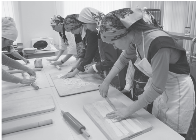
Многие школьницы уже умеют готовить любимое национальное блюдо.

- Нам очень понравилось это мероприятие. Было интересно наблюдать, как наши педагоги умело раскатывают и нарезают тесто. Мы с удовольствием участвовали в гу-