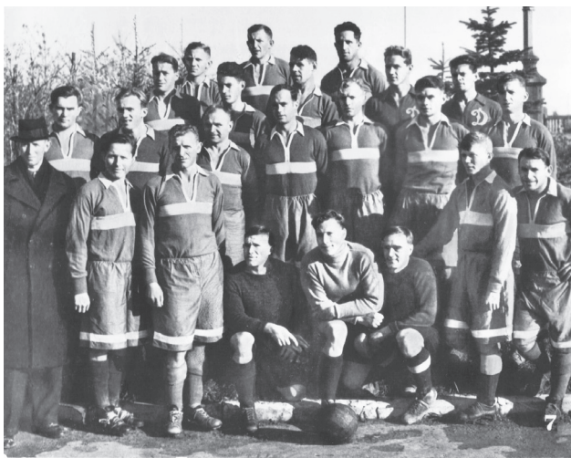
Команда 1945 года перед отъездом в Англию. Издательство «Планета», 1977 год.

Помню, я подумал: «Батюшки, какой еще может быть футбол в стране, которая только что пережила страшную войну и наполовину лежит в руинах?!» Но факт оставался фактом: британское правительство в знак дружбы и признания заслуг Советского Союза в Победе действительно предложило одной из футбольных команд (ей стало «Динамо») провести серию товарищеских матчей с клубами Великобритании. Я думаю, даже не сомневаюсь,