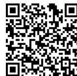
Видео выступлений Даниила - здесь.

Материалы полосы подготовил АНДРЕЙ НИЧКОВ.