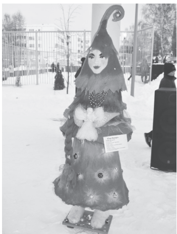
1 место - елка «Ворожея».

В нем могут участвовать жители республики, оформившие подписку на городскую или районную газету в этот период времени. Разыгрывается суперприз - морозильный ларь! Копии квитанций нужно отправлять по адресу: г. Уфа, ул. 50-летия Октября, 13, каб. 212, с пометкой «Новогодний марафон подписки» или на электронную почту podpiska@rbsmi.ru .