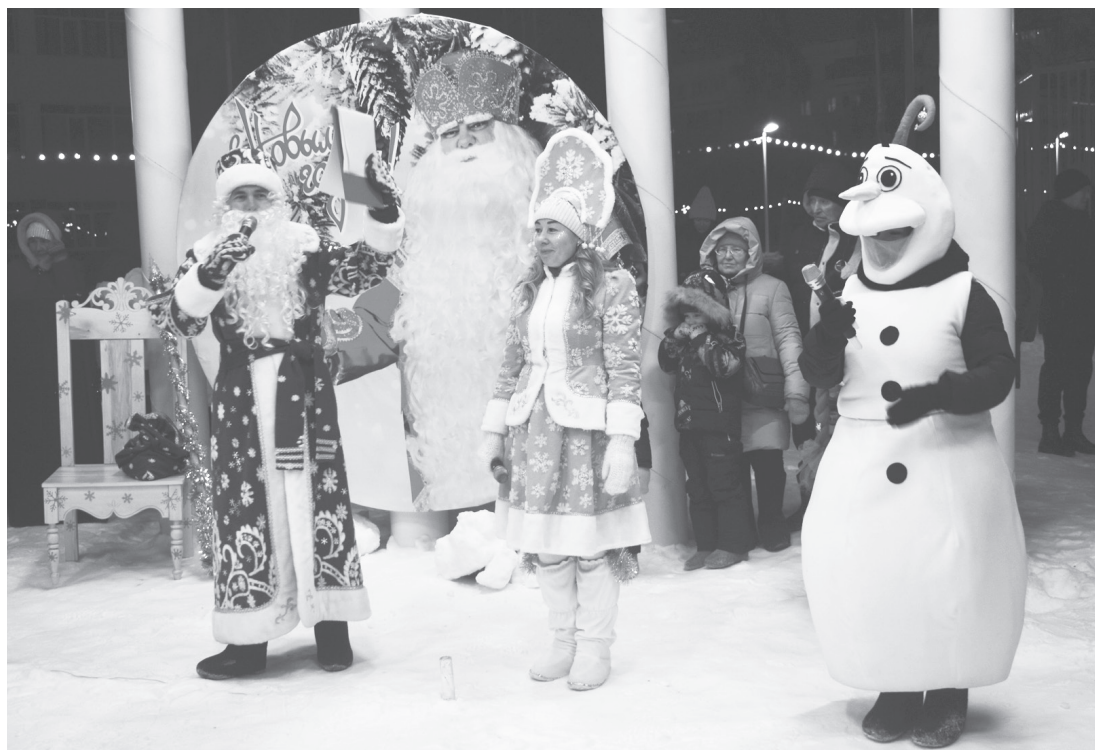
Впервые Дед Мороз со Снегурочкой появились в парке «Волны Агидели» уже 15 декабря.