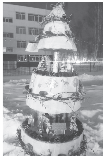
2 место - елка «В блеске лучистых огней».

На втором месте оказалась не менее необычная елка, выполненная педагогами детского сада №5 «Пин и ГВИН» Татьяной Салиховой, Юлией Петровой и Разией Султановой. Они назвали свое творение «В блеске лучистых огней». Это трехъярусное сооружение, выполненное в технике папье-маше, с использованием пенопласта, картона и сухостоя.