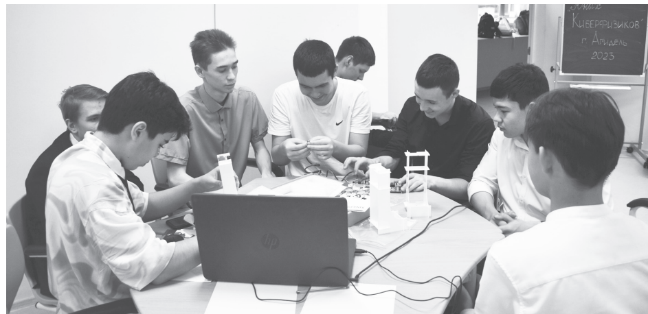
Юные киберфизики собирают акустическую систему.

На базе Детского Технопарка при Центре дополнительного образования «Савитар» стартовал «Турнир юных киберфизиков» по теме «Акустика». Участниками состязания стали старшеклассники школы № 1, школы № 2 и Башкирской гимназии.