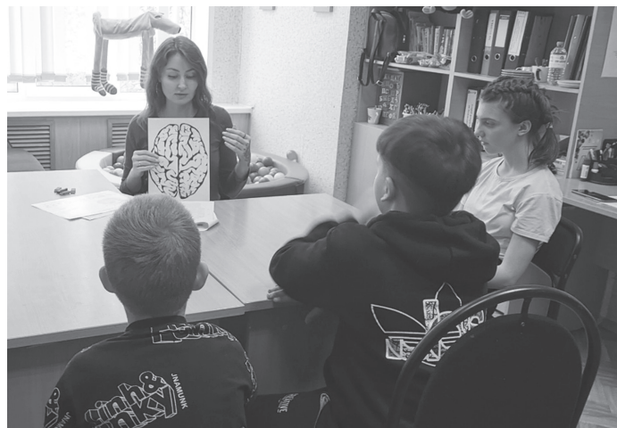
Дети с удовольствием приходят на занятие «МегаМозг».

При регулярных занятиях замечено улучшение памяти, человек становится более внимательным, легче справляется с эмоциями, у детей повышается успеваемость