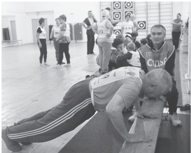
Для сдачи норм ГТО возраст - не помеха!

После пройденных спортивных этапов состязания события перенесли в плавательный бассейн, где пенсионерам предстояло проплыть дистанцию 25 метров на время. Здесь за ходом за-