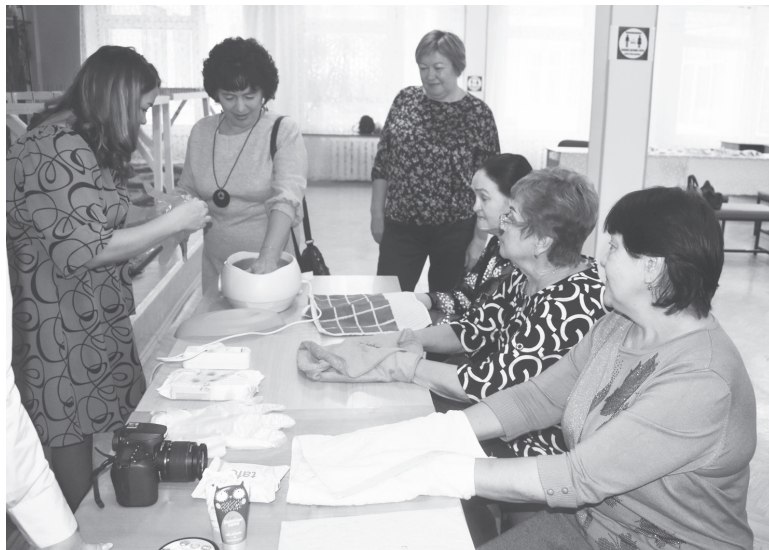
Гостям провели процедуру парафинового обертывания.

Музыкальную часть программы заполнили солисты народного ансамбля русской песни «Зоренька», которые а капелла ис-