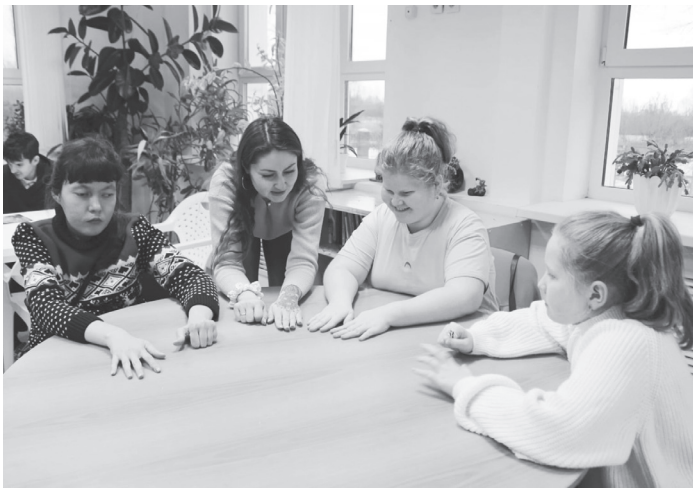
На занятиях по проекту «Другие грани».

Напомним, регулярные тренировки способствуют развитию баланса и синхронизации межполушарного взаимодействия,