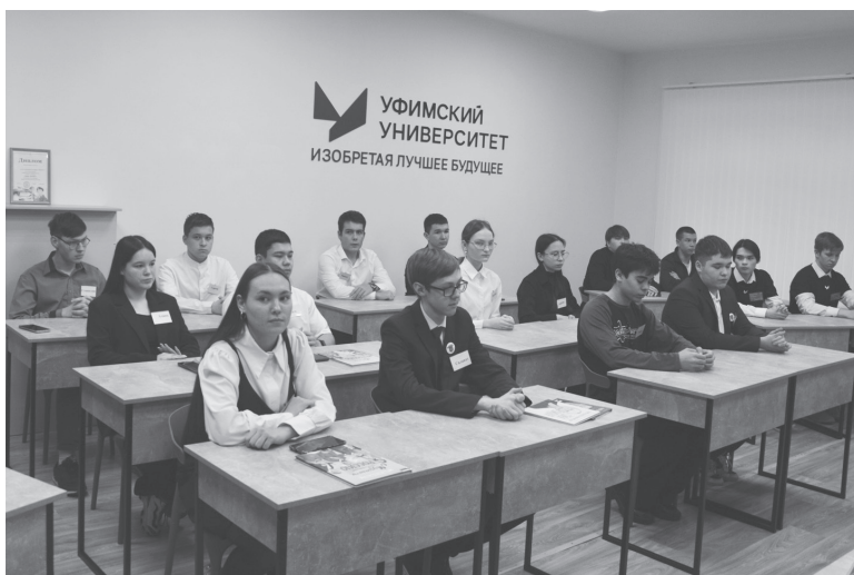
Школьники с интересом слушали рассказы гостей о студенческой жизни.