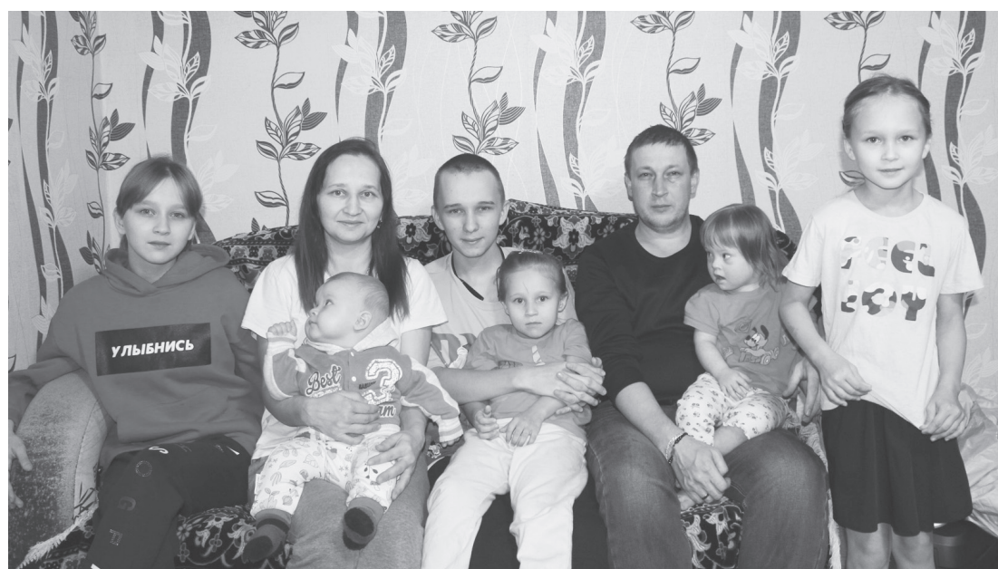
Вот это действительно многодетная семья!