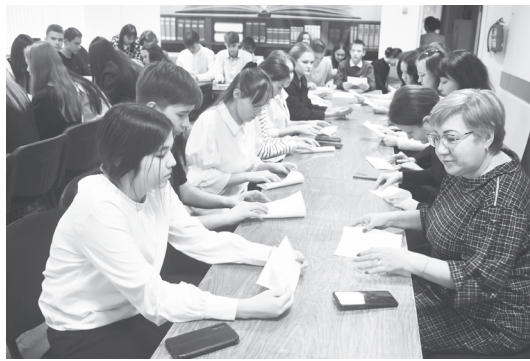
Школьники вместе с учителями изготовили из бумаги белых журавлей.

Ответив на несколько вопросов по сюжету повести, ребята поделились своими впечатлениями о произведении. Отвечая на вопрос: «Вы смогли бы так же принять в свою семью, в свой дом, в своё сердце другого человека? Легко ли это сделать?», – ребята не задумываясь, дали положительный ответ.