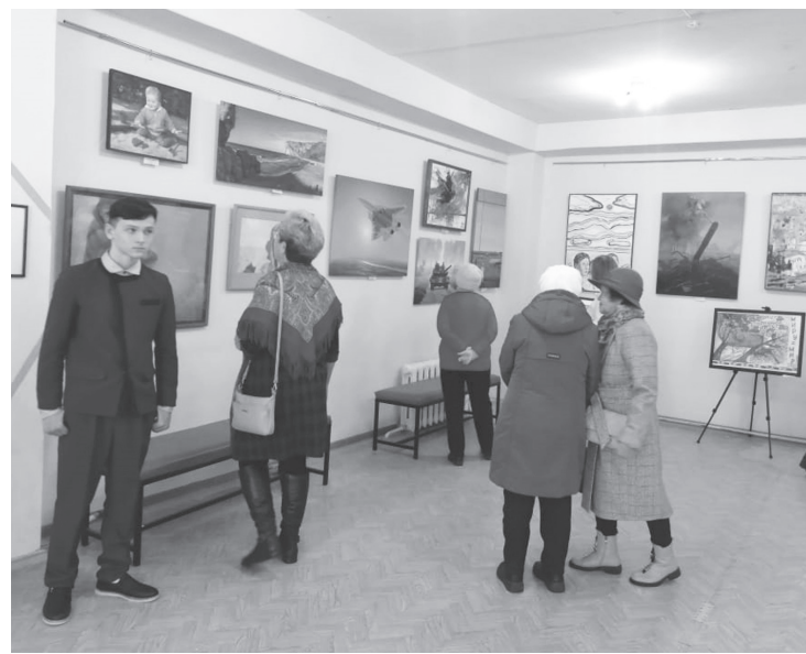
В выставочном зале зрители рассматривают картины, посвященные специальной военной операции.