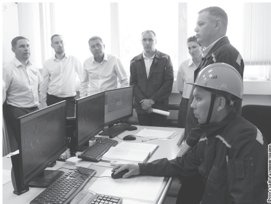
Участники зонального совещания посетили агидельскую котельную и наблюдали за учениями по ликвидации аварии.

Старший государственный инспектор отдела государственного энергетического надзора РБ (Ростехнадзор)