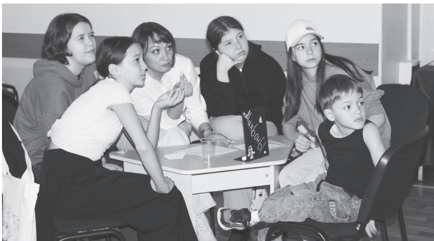
Игра была не только веселой, но и напряженной.

«Ум за разум» - так называлась семейная КВИЗ-игра, которая прошла в субботний вечер в Центральной библиотеке в рамках Всероссийской акции «Библионочь-2024», которая в этом году проходит под девизом «Читаем всей семьей».