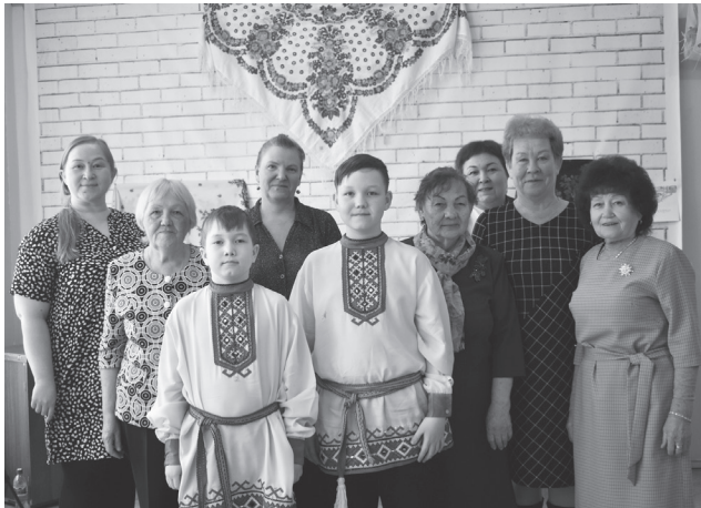
Члены марийского клуба «Вис-Вис».

Марийский богатырь Иден славен был как защитник марийцев, который в день мог съесть до трех быков. Когда пришла пора умирать, Иден предсказал соплеменникам, что с юга идут орды кочевников. Богатырь, видя горе сородичей, согласился последний раз помочь им, предложив перебраться по нему, как по мосту, на север, через речки, леса и овраги. Распластался богатырь по земле и испустил дух. Марийцы пошли по нему, те, кто шли по правой руке, перешли реку Ош (Белую). Левая рука не выдержала, лопнула и из нее разлилась медовуха. Марийцы, которые шли по левой руке, утонули в ней. С тех пор на этом месте течет река Бирь. Гора Красная появилась на месте, где выступила его кровь, окропившая землю.