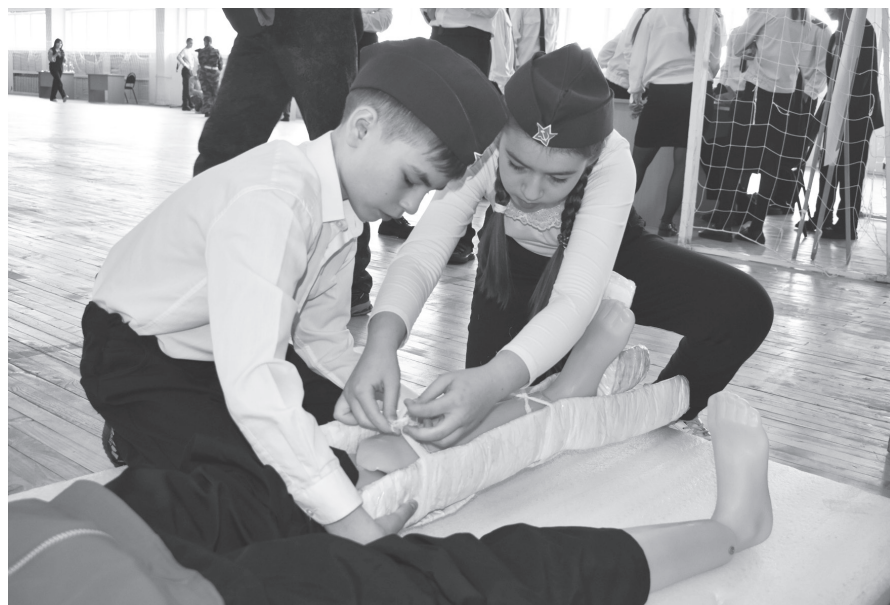
Умение оказывать первую медицинскую помощь – самое важное качество для будущих защитников Родины.

В республике продолжается набор на контрактную службу. По вопросам